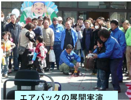
エアバックの展開実演

また、点検教室のマニュアル化にむけたアンケート調査の実施、日頃のメンテナンスの必要性を呼び掛ける展示ブースの設置、来場者の目前で展開されたエアバック実演には驚きながらも真剣に見学されました。