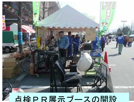
点検PR展示ブースの開設