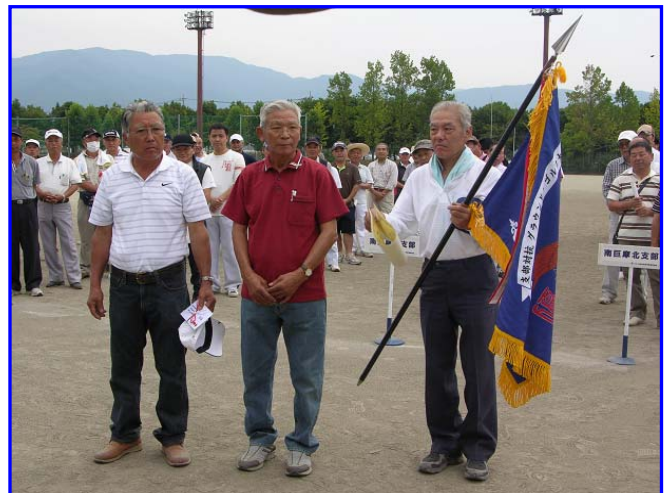
優勝した甲府南支部