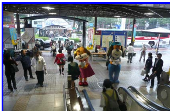
甲府駅前広報活動