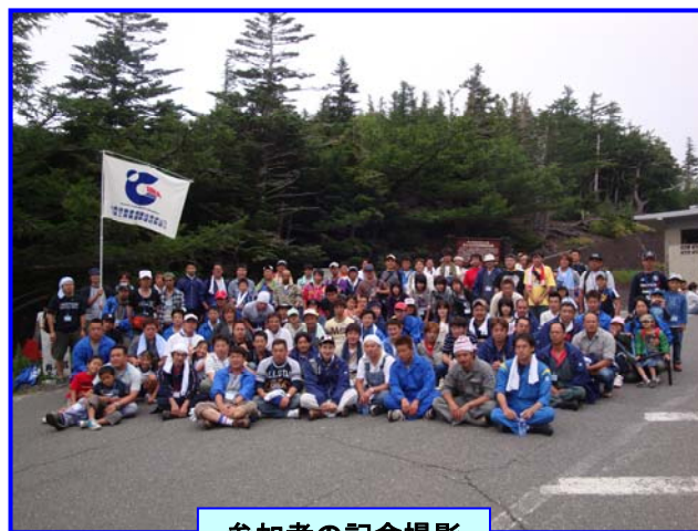
参加者の記念撮影