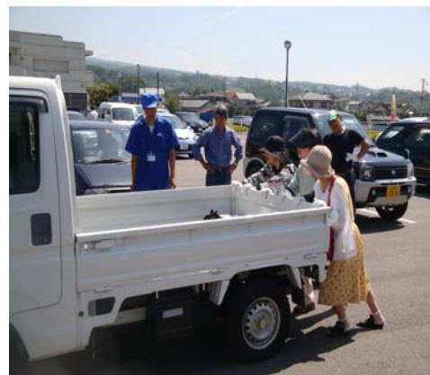
タイヤの空気圧不足を体験