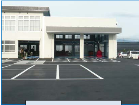
教育実習場増築部全景