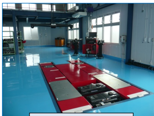
四輪アライメントテスト