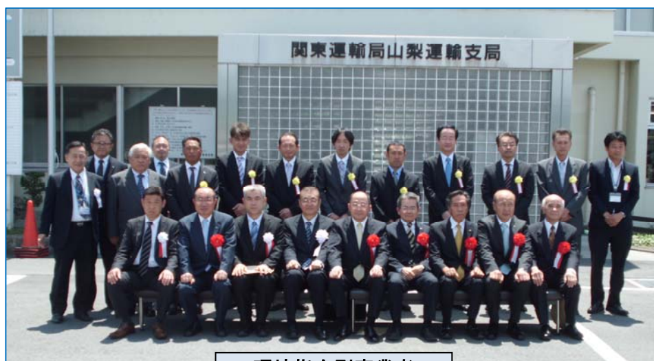
環境指向型事業者