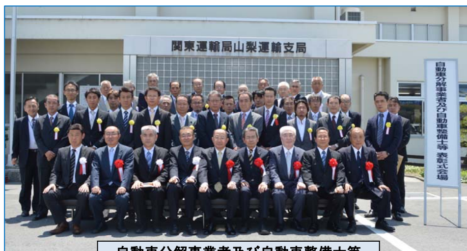
自動車分解事業者及び自動車整備士等