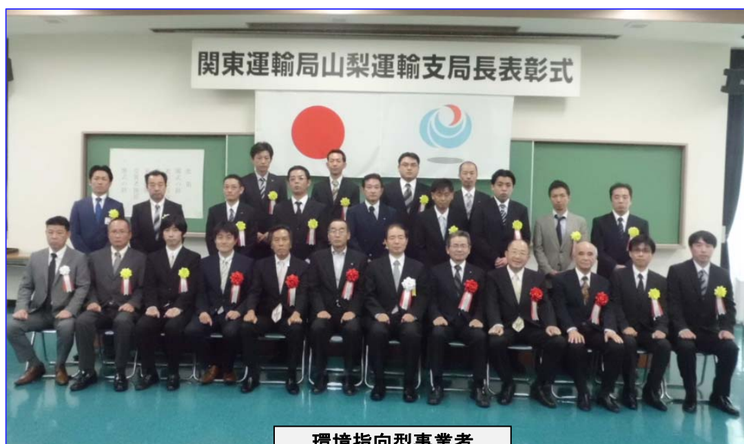
環境指向型事業者