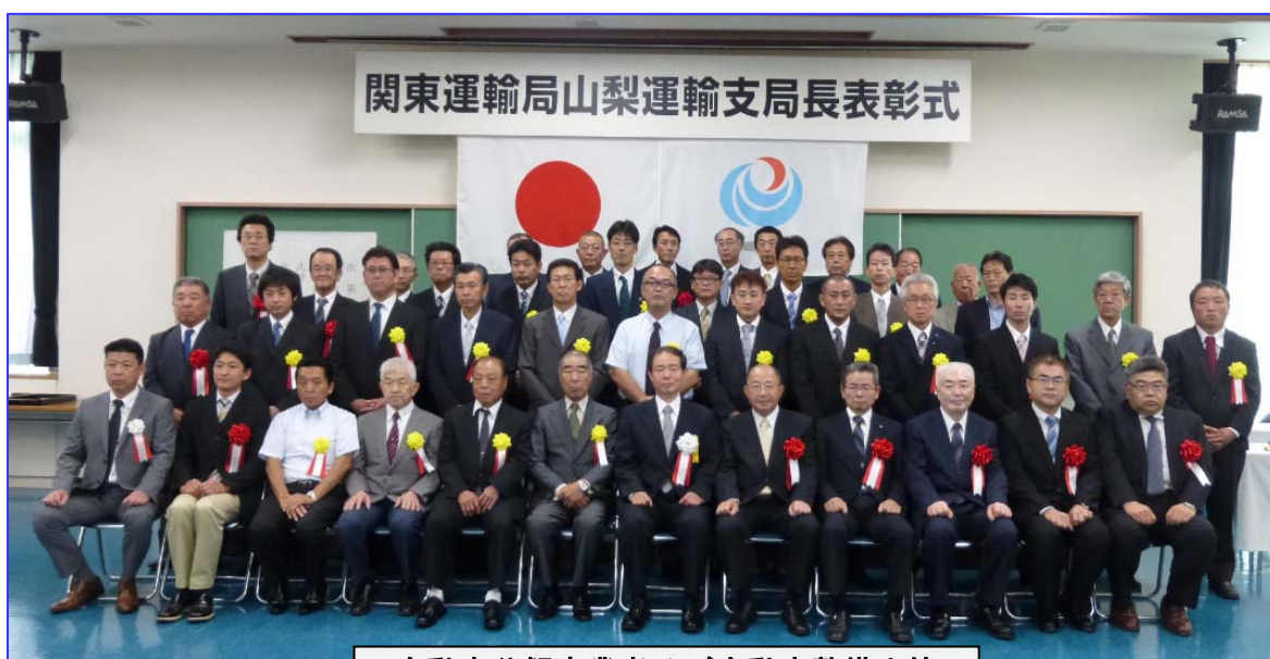
自動車分解事業者及び自動車整備士等