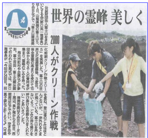
H27.8.2 山梨日日新聞 掲載