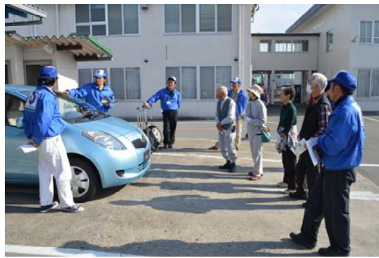
笛吹市マイカー点検教室