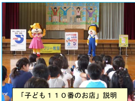
「子ども110番のお店」説明

◇「子ども110番のお店」校内掲示用ポスター、クリアケース、保護者宛チラシ、石和東小学校学区内子ども110番のお店（整備工場）マップとチラシを配布