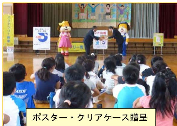
ポスター・クリアケース贈呈