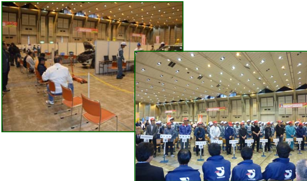
前回（第２１回大会）の様子（平成２８年１０月２９日：アイメッセ山梨にて開催）

以上、第２２回山梨県自動車整備技能競技大会要綱が決定しましたので、今後各支部において出場選手選考をお願いいたします。