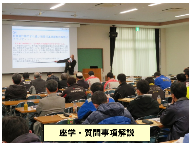
座学・質問事項解説