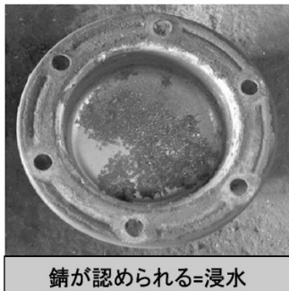
錆が認められる=浸水