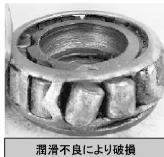
潤滑不良により破損