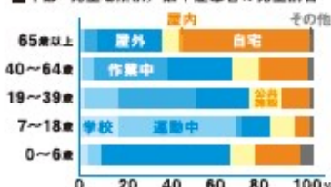
■年齢・発生場所別/熱中症患者の発生割合