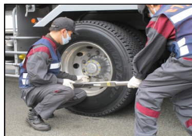
街頭検査の様相（令和2年度）