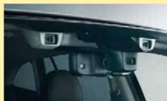
複眼カメラ (スバルHPより)