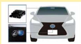
カメラ・ミリ波レーダー複合型