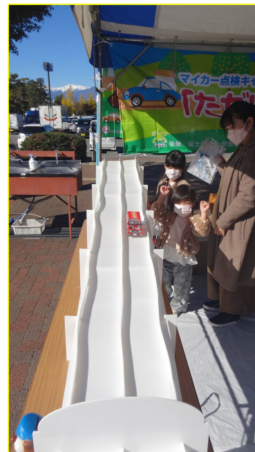
ペーパークラフト号コーナーの様様