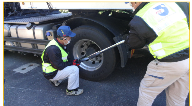
締付けトルク確認の様様