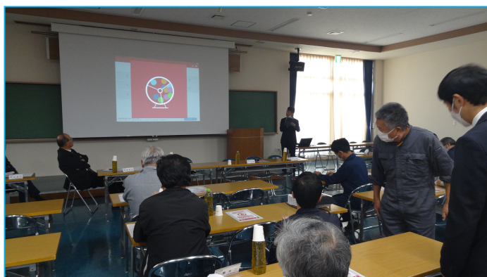
11月8日（水）抽選会の模様

◇当選者数 A賞 Nintendo Switch 2名様 B賞 カタログギフト(5,000円分) 20名様 C賞 車検・定期点検5,000円割引クーポン 100名様 D賞 オリジナルデザインQuoカード(1000円分) 50名様