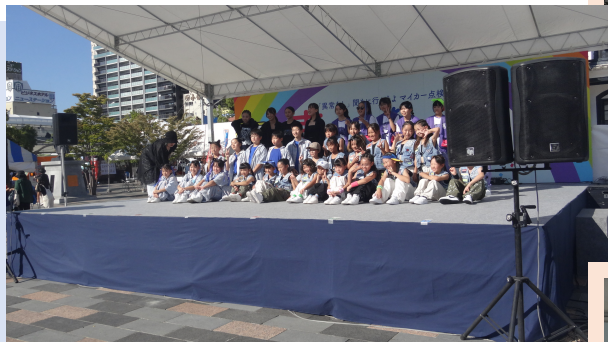
スタジオビートサーフ