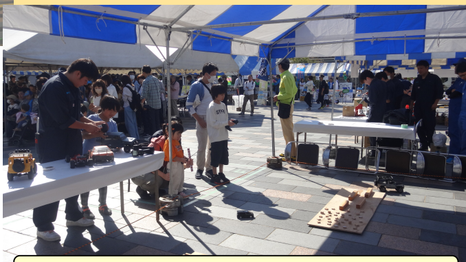
ラジコンで車の構造を学んでみよう (峡南技専)