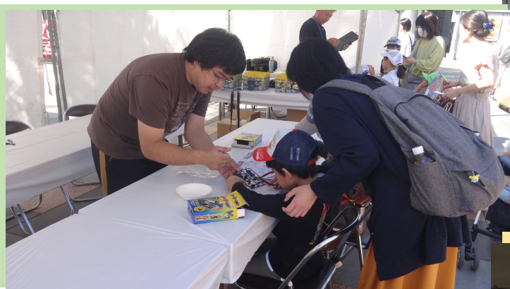
動く模型組み立て教室 (模型 & JOY)