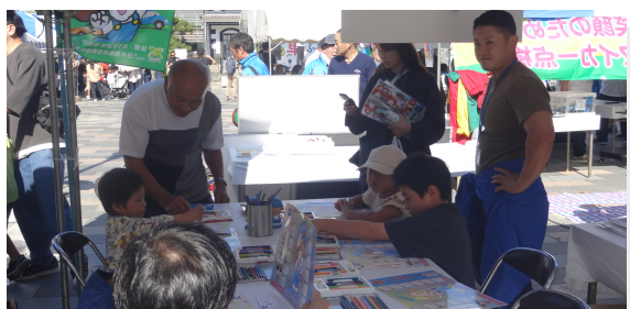
子ども110番のお店 めり絵コーナー