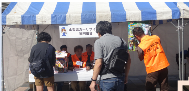
自動車リサイクル部品の展示、提案 (山梨県カーリサイクル協同組合)