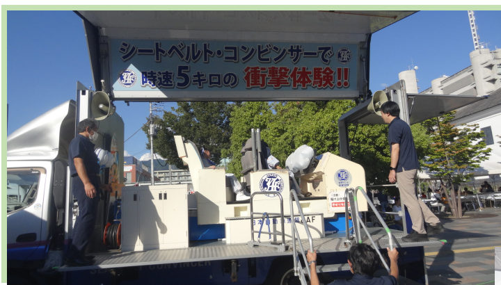
シートベルトコンビンサー (JAF山梨)