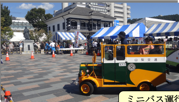
ミニバス運行・レトロバス展示 (山梨交通)