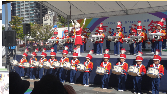
城北幼稚園 マーチング