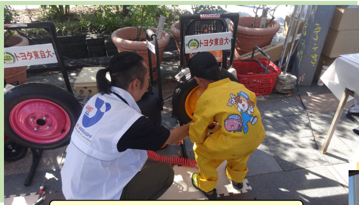
キッズエンジニア体験コーナー