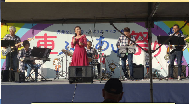
菰崎スウィングハート