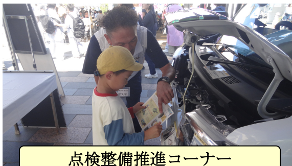
点検整備推進コーナー