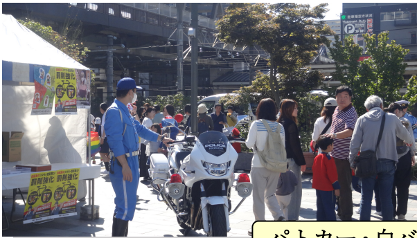
パトカー・白バイ展示 (山梨県警)