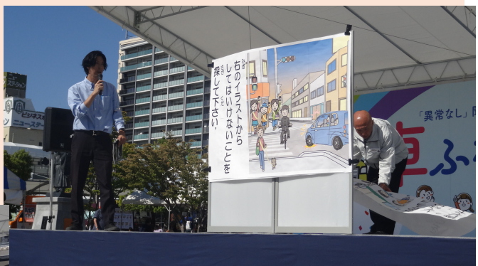
交通安全クイズ(山梨県交通安全協会)