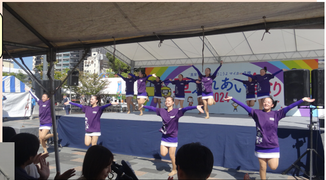
甲府商業高等学校 ソングリーダー