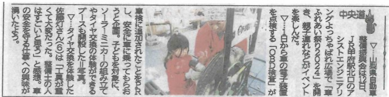
10月13日(日) 山梨日日新聞掲載