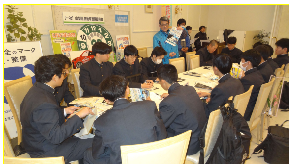
屋内ブースの様様