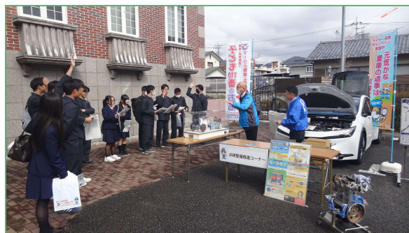
屋外ブースの様様

*経営委員会 委員の皆さま、AMS 山梨青年部 執行部の皆さま ご協力ありがとうございました。